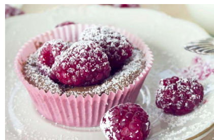
Schokomuffins mit Himbeeren