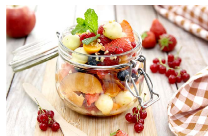
Obstsalat im Glas