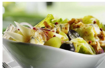
Eisbergsalat mit Trauben