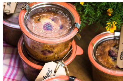
Zwetschgenkuchen im Glas